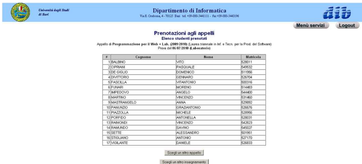
Figura 3: Esercizio XHTML e CSS

In particolare la tabella presente in figura 3 deve essere popolata mostrando per tutti gli studenti presenti nella risorsa studenti.xml i dati per essi definiti.